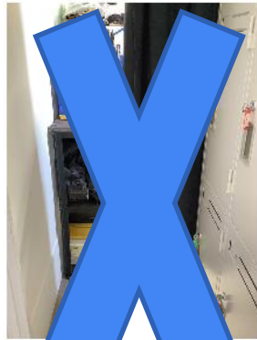
ロビーの倉庫 塵取りが置いてあります。