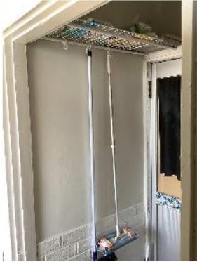
女性用トイレ前 上の棚にはクイックルワイパーのシート等があります。