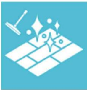
【床】 ほうき、クイックルワイパーで掃除してください