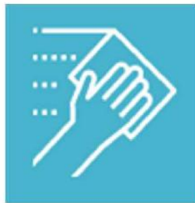
【設備/備品/鏡】 ご使用後は雑巾やウェットティッシュで必ず拭いてください