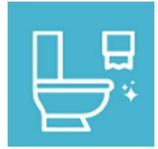
【トイレ】 汚した場合は必ず掃除してください