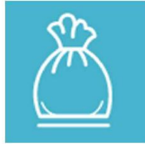
【ゴミ】 必ずお持ち帰りください